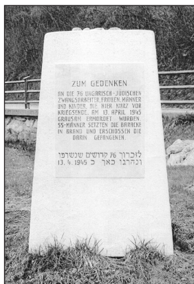
Gedenkstein im Ortszentrum von Göstling

Zum Angedenken an die 76 Märtyrer, die hier am 13. 4. 1945 verbrannt und ermordet wurden.